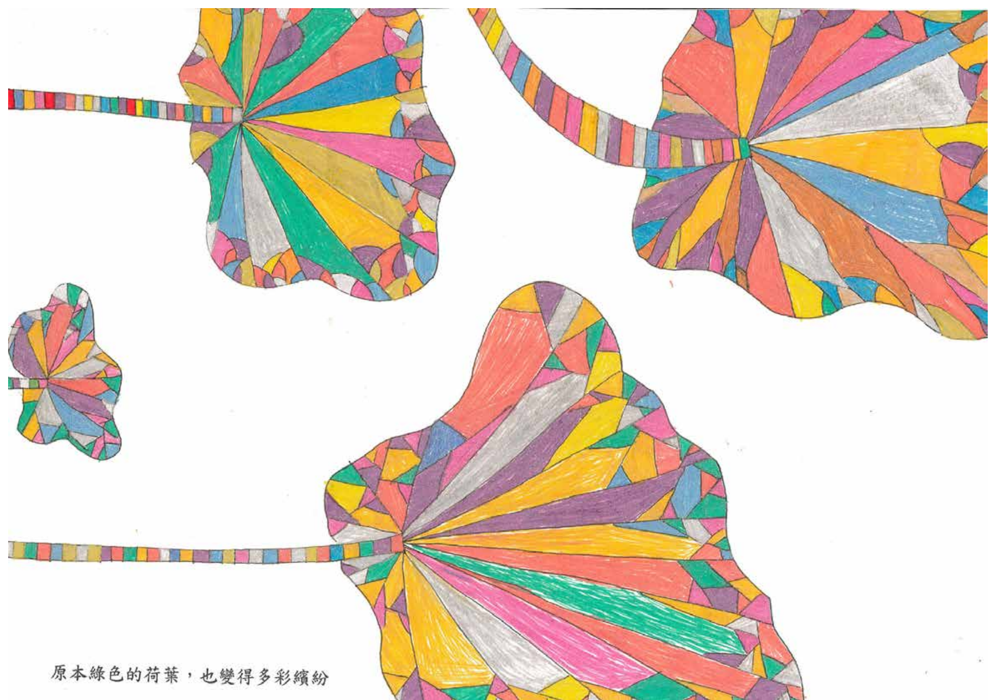
原本綠色的荷葉，也變得多彩繽紛